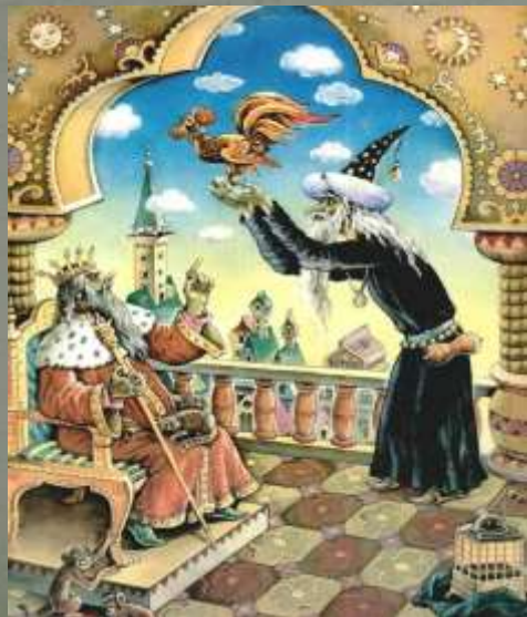
«Сказка о золотом петушке»

«Сказка о царе Салтане, о сыне его славном и могучем богатыре князе Гвидоне Салтановиче и о прекрасной царевне Лебеди»