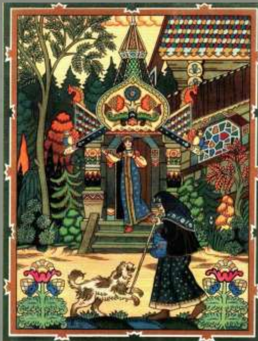
«Сказка о мертвой царевне и семи богатырях»